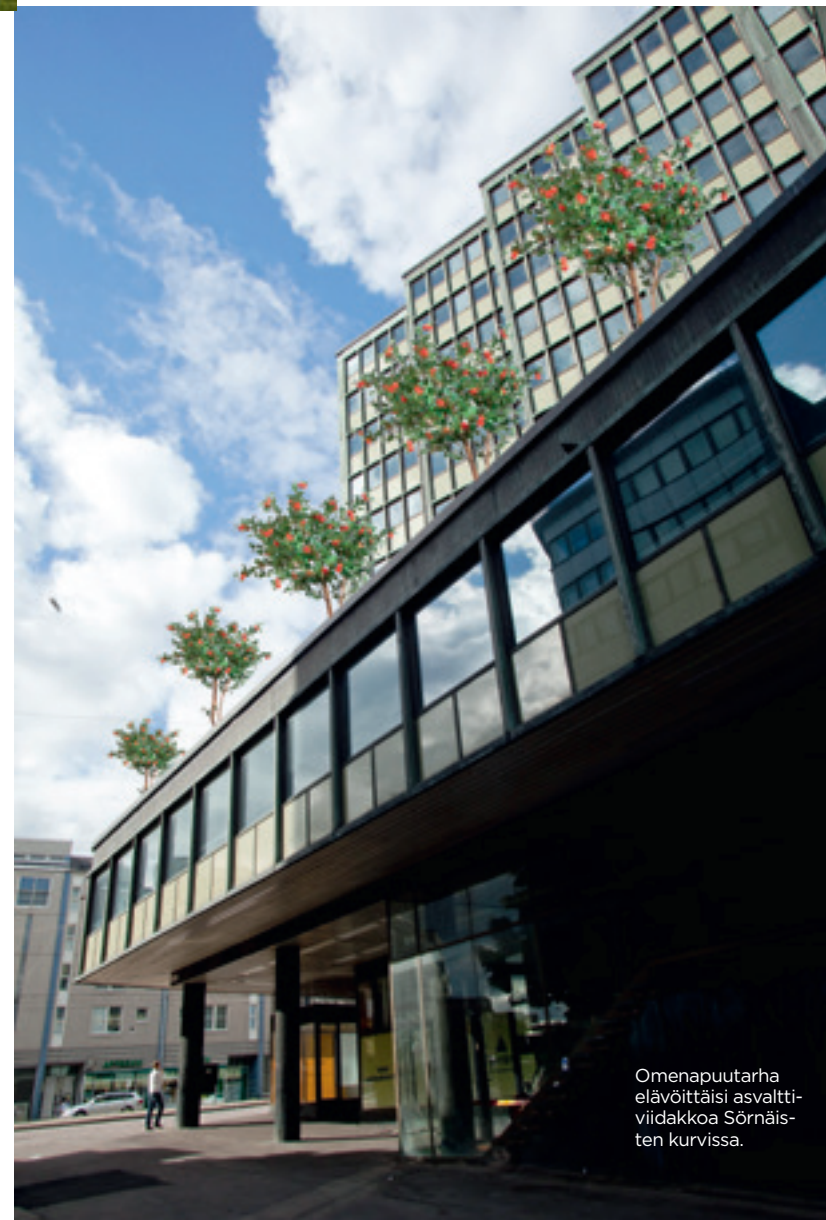
Omenapuutarha elävöittäisi asfaltti- viidakkoa Sörnäisten kurvissa.

Luontoa ei voi koskaan täysin hallita. Sen tajuaminen tekee hyvää.