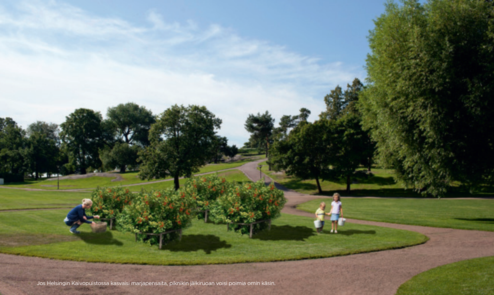
Jos Helsingin Kaivopuistossa kasvaisi marjapensaita, piknikin jälkiruoan voisi poimia omin käsin.