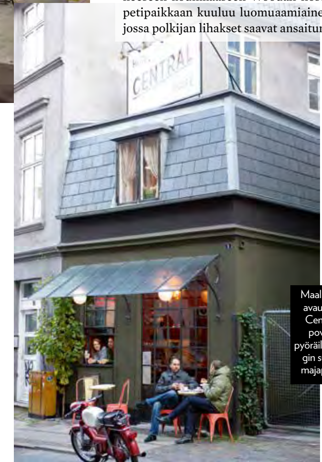
Maaliskuussa avautuvasta Centralista povataan pyöräilykaupungin suosikkimajapaikkaa.

”Tästä vain sattuvat hyötymään kaikki osapuolet.”