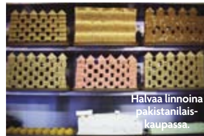
Halvaa linnoina pakistanilaiskaupassa.